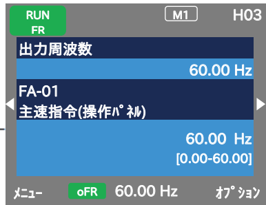
パラメータ設定画面