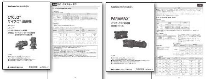
取扱説明書の潤滑油に関する記載箇所一例

潤滑油についてご不明な点は、最新の取扱説明書を参照いただくか、お問い合わせください。